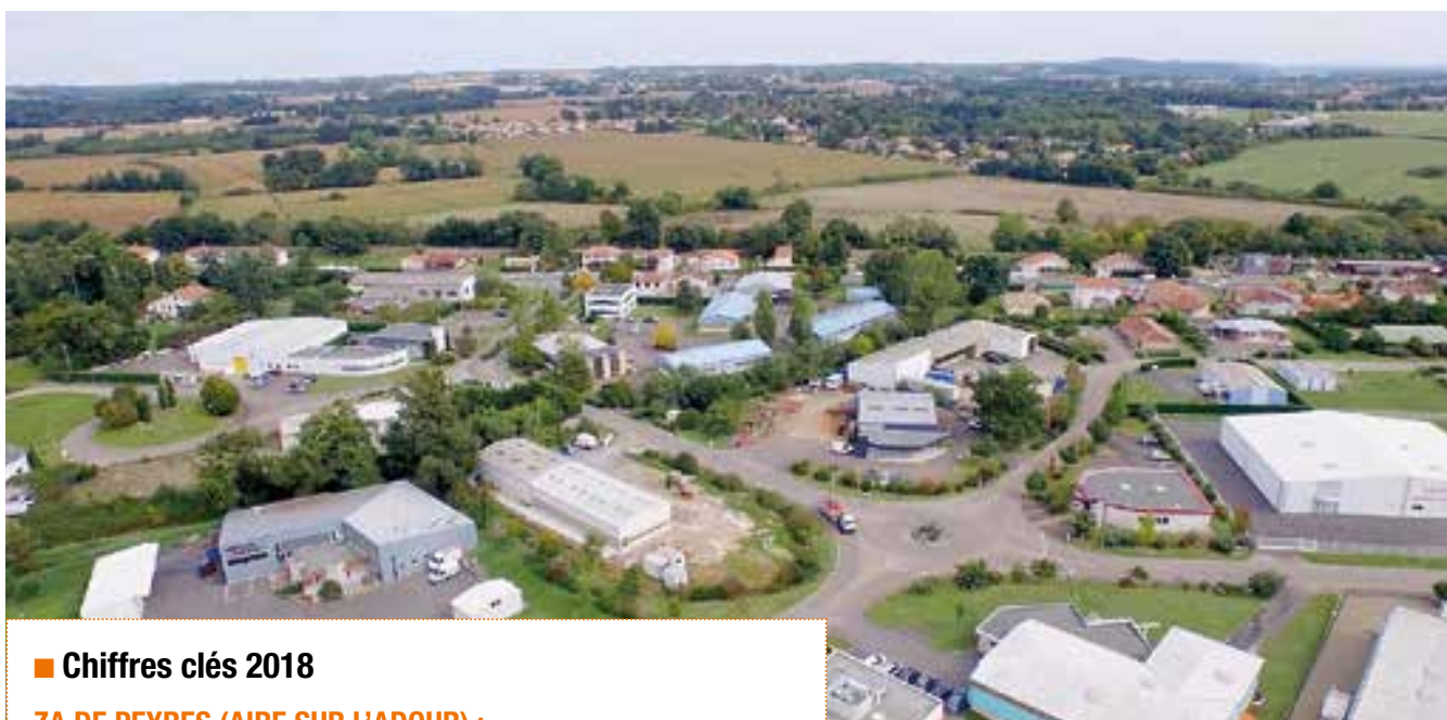
ZA DE PEYRES