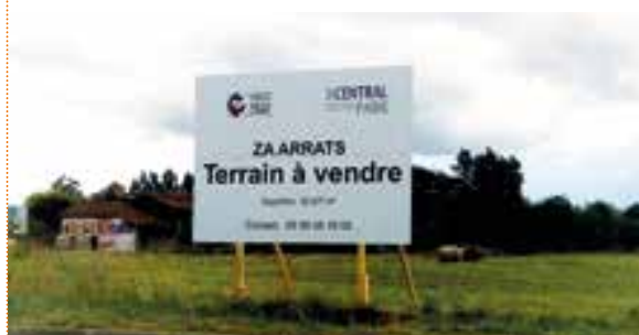
LA RÉSERVE FONCIÈRE DES ARRATS