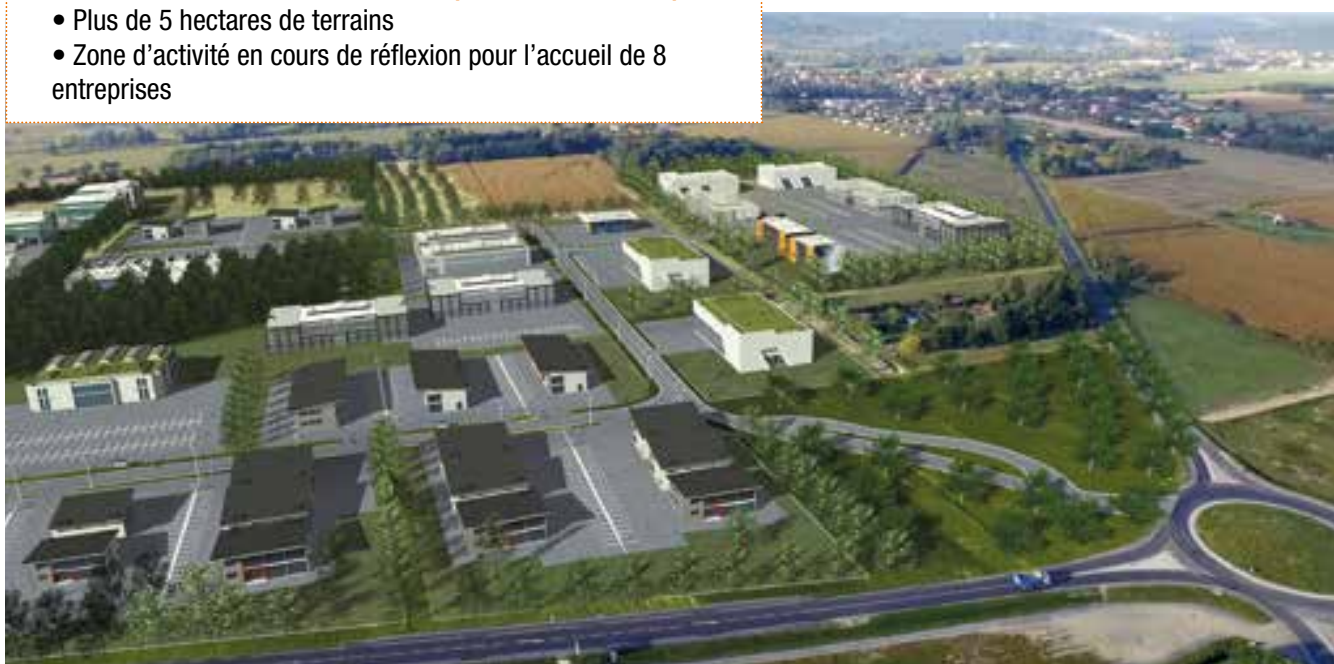
ZA DE BASSIA